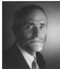
Dr. Jakob KELLENBERGER