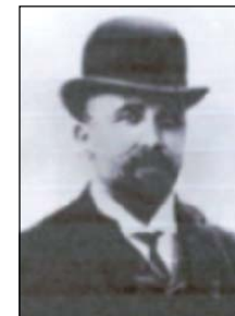
Dr. Felix Hoffman

Aspirin je možná neznámější prášek používaný ke zmírnění bolesti. Lidé po dlouhá staletí věděli, že použití určitých rostlin nebo kůry některých stromů může zmírnit bolesti hlavy a revmatické potíže. Později objevili i důvod - přítomnost kyseliny acetylsalicylové.