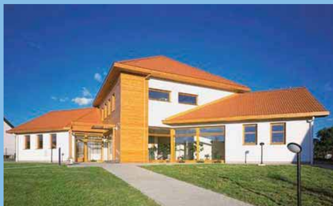
Dům seniorů – Ostrožská Nová Ves