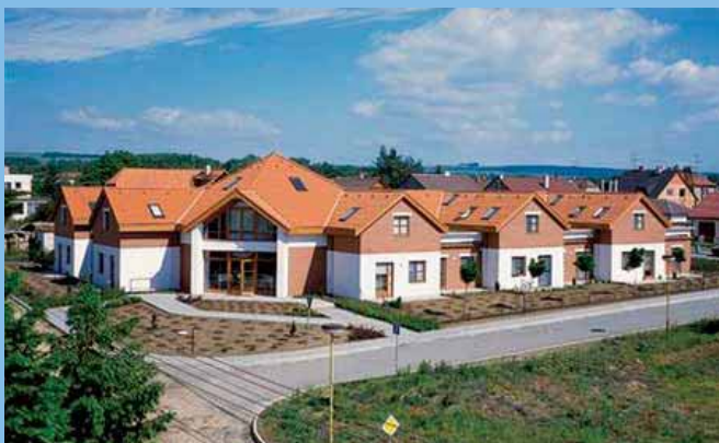
Dům seniorů – Moravský Písek