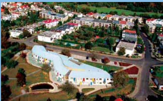
Dům seniorů „Hvězda“