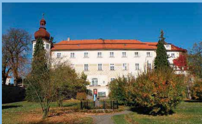
Dětská odborná léčebna – Bukovany