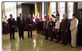
Staroměstská radnice – předávání vyznamenání

Stejně jako v předchozích letech pořádal Český červený kříž různé reprezentativní akce, které souvisely s jeho programovými činnostmi. V rámci těchto akcí se setkalo 25 bezplatných dárců krve s první dámou, z rukou předsedy Senátu PCR převzali 4 zasloužilí členové ČČK Medaili Alice Masarykové, 347 bezplatným dárcům krve bylo předáno nejvyšší vyznamenání ČČK – Zlaté kříže 1. a 2. třídy, sešli se ředitelé