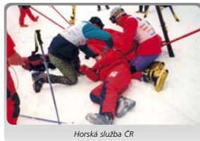
Horská služba ČR

Základní činnost Horské služby ČR je i nadále organizována a financována obecně prospěšnou společností Horská služba ČR, o.p.s., která celoročně zaměstnává 70 profesionálních záchranářů a 5 administrativních pracovníků. Horská služba ČR působí v 7 horských oblastech, ve kterých zejména organizuje a provádí záchranné a pátrací akce v horském terénu, poskytuje první pomoc, zajišťuje transport zraněných a nemocných a další aktivity.