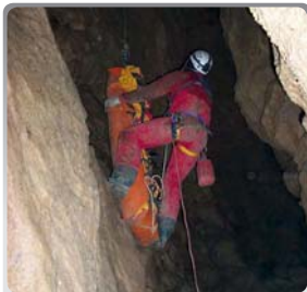
Nácvik transportu v jeskyni

SZS ČSS je zaměřena na záchranu při nehodách v jeskyních, kde nemůže jiný záchranný sbor zasáhnout především pro neznalost tohoto extrémního prostředí. Působí v ní 30 zkušených jeskyňářů, kteří prochází pravidelným výcvikem a kteří jsou schopni poskytnout kvalifikovanou pomoc ve velmi obtížných podmínkách složitých jeskynních systémů. SZS ČSS také pravidelně pořádá lezecké výcvikové akce pro jeskyňáře i širší veřejnost.