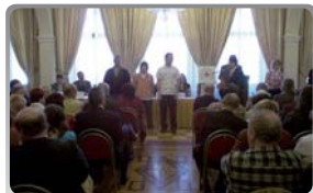
Kaiserštejnský palác – „Zlaté kříže Praha“