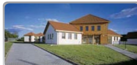
Dům seniorů – Ostrožská Nová Ves