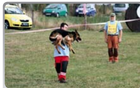
Svaz záchranných brigád kynologů ČR

SZBK ČR je zakládajícím členem mezinárodní organizace IRO koordinující dnes činnost 42 organizací z celého světa. Sdružuje členy zabývající se výcvikem psů ve vyhledávání živých i mrtvých osob v nejrůznějších prostředích – od zimních sněhových podmínek přes neprostupné přírodní terény, vyhledávání v sutinách pobořených domů, továren a objektů, až po vyhledávání utonulých osob pod vodní hladinou. Psovodi SZBK ČR se zúčastňují i zahraničních misí po zemětřeseních v nejhůře postižených oblastech.