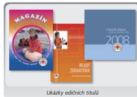
Ukázky edičních titulů

tečnila ve spolupráci s Vyškovskou vojenskou akademií a ČČK vyškolil 43 nových školitelů (diseminátorů). Proběhlo 250 akcí a s tematikou mezinárodního humanitárního práva se tak mělo možnost seznámit 7 827 posluchačů.