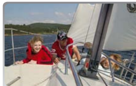
Česká unie námořního jachtingu

ČUNJ se věnuje především přípravě svých členů pro vnitrostátní a mezinárodní plavbu. V rámci své vzdělávací činnosti pořádá velké množství kurzů jako např. vůdce malého plavidla, velitel námořní jachty – způsobilost B a další. V současné době připravuje akreditaci nově vznikající Vyšší odborné školy vodní dopravy a managementu.