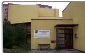
Dům sociálních služeb – Praha 9