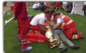
Mezinárodní soutěž FACE 2009