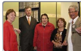
Mezinárodní pátrací služba Bad Arolsen – setkání se šťastným žadatelem