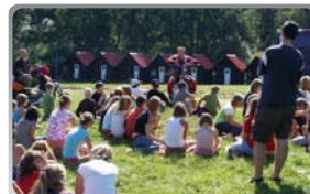
Letní rekondiční pobyty