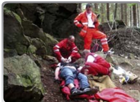
Kubínův memoriál 2009