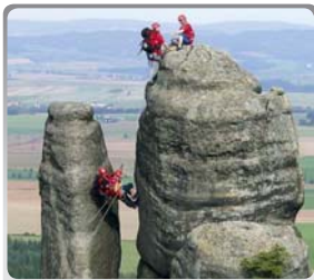
Skalní záchranná služba CHKO Broumovsko

Posláním a cílem Skalní záchranné služby je pomoc při záchranných pracích profesionálních složek Integrovaného záchranného systému Královéhradeckého kraje územního odboru Náchod, zejména Hasičského záchranného sboru, Zdravotnické záchranné služby a Policie ČR. Tato pomoc obsahuje zejména poskytnutí první předlékařské pomoci, vyproštění postižených z nepřístupných míst, transport v nepřístupném terénu k dopravním prostředkům či pomoc při pátracích akcích v nebezpečném terénu.