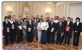
Bezplatní dárči krve na Pražském hradě