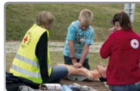
Praktické prověřování první pomoci

ČČK je jako jediný v ČR držitelem Evropského certifikátu první pomoci udělovaného Evropským referenčním centrem ČK pro „Základní normu zdravotnických znalostí“ (od roku 2000) a pro zdravotnickou přípravu uchazečů o řidičský průkaz (od roku 2004). Rozhodnutím „Evropského referenčního