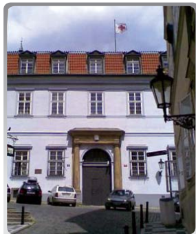
Sídlo ČČK v Praze

Posláním Českého červeného kříže je zejména předcházet a zmírňovat lidské utrpení, chránit zdraví, život a úctu k lidské bytosti, podporovat vzájemné porozumění, přátelství a mír mezi národy bez rozdílu národnostních, rasových, náboženských, třídních a politických a usilovat o naplňování základních principů hnutí Červeného kříže – humanita, neutralita, nestrannost, nezávislost, dobrovolnost, jednota a světovost.