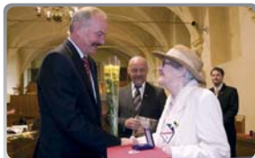
Senát PCR – slavnostní shromáždění ČČK