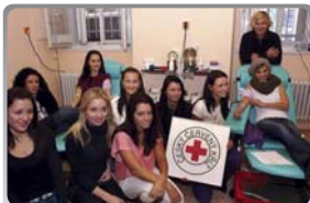
Zpěvačka Aneta Langerová a zpěvák skupiny Support Lesbiens Kryštof Michal – odběrová akce ve VFN

Ú ČČK se podílí společně s představiteli M-ČČK na organizování přednášek s tematikou BDK, které jsou koncipovány jako neformální setkání a probíhají za účasti lékáře nebo přímo primáře TO, zástupce ČČK