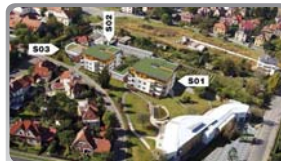
Dům seniorů – Hvězda. Vpředu dostavěný objekt, v pozadí vizualizace rozestavěného objektu. (SO 1 – 30 byt. jednotek a rehabilitace, SO 2 – 30 byt. jednotek a pečovatelská služba, SO 3 – stravovací a konferenční objekt)