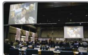
Keňa, Nairobi – statutární zasedání Hnutí ČK/ČP

Mezinárodní spolupráce také znamená účast ČČK na tradiční soutěži v první pomoci, která probíhá pod názvem FACE a kde mají možnost „změřit své síly“ účastníci z jednotlivých zemí EU. V uplynulém roce ČČK také spolupřádal dvě konference s mezinárodní účastí, které byly pořádány při příležitosti 60. výročí podepsání Ženevských úmluv (1949).