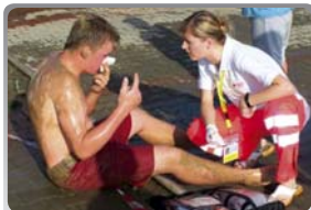
Pomoc v terénu – povodně 2009