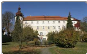
Dětská odborná léčebna Ch. G. Masarykové – Bukovany

Léčebna má kapacitu 120 míst a je určena dětem od 1 roku do 18 let. Lékařská péče je zaměřena na nemoci horních cest dýchacích, astma, alergie a kožní nemoci. Náklady na léčebnou péči jsou hrazeny zdravotními pojišťovnami. Součástí péče je i předškolní výchova dětí a školní výuka, včetně výuky cizích jazyků. Léčebna zajišťuje i pobyty dětí s doprovodem. Během pobytu dětských pacientů a rodičovského doprovodu v léčebně jsou pro ně