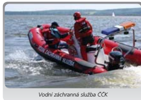
Vodní záchranná služba ČČK

Vodní záchranná služba Českého červeného kříže (dále jen VZS ČČK) je občanské sdružení, nestátní nezisková organizace, jehož hlavním posláním je preventivní a záchranná činnost u vodních ploch, příprava a výcvik svých členů, včetně dětí a mládeže VZS ČČK. Při živelných katastrofách a obecném ohrožení, v rámci IZS, zabraňují vyškolení členové vážným úrazům, utonutím a ztrátám na materiálních hodnotách.