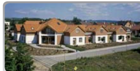
Dům seniorů – Moravský Písek

V rámci plánované dostavby je dokončován ubytovací objekt se 30 malometrážními byty a pečovatelskou službou v přízemí. Hlavní důraz je kladen na kvalitu materiálů, prací i na vybavení nejmodernější komunikační a zabezpečovací technikou. Dále chceme aktuálně pokračovat ve výstavbě stravovacího a rehabilitačního komplexu, což bude ovšem závislé na zajištění finančních zdrojů.