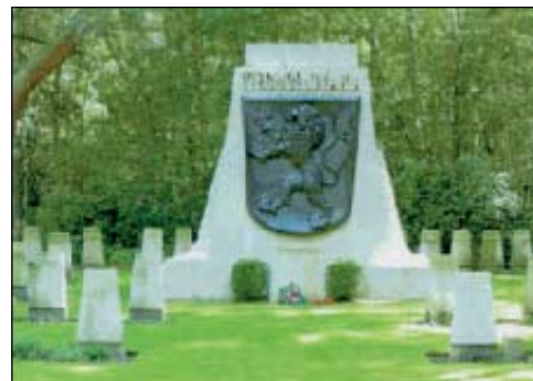
Hřbitov čs. vojáků v Londýně - Brookwoodu