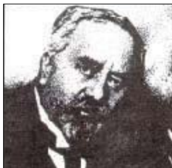
A. L. Ch. Calmette

„Vy jste si opravdu nevšimla, že váš muž prodělal srdeční infarkt?“ ptá se lékař. „Ne,“ říká žena. „Jen mi bylo divné, že po 30 letech manželství muž najednou řekl: „Ó, Maruško, moje srdce!““