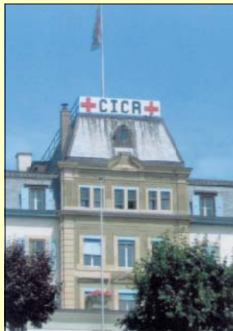
Sídlo MV ČK v Ženevě

Ve dnech 20. - 22. června 2006 se v Ženevě uskutečnila mimořádná XXIX. Mezinárodní konference Červeného kříže a Červeného půlměsíce (MK ČK a ČP) za účasti delegací 178 národních společností ČK a ČP, 148 vlád, Mezinárodního výboru ČK a Mezinárodní federace ČK a ČP. Původně se XXIX. MK ČK a ČP měla konat v roce 2007, tedy obvyklé čtyři roky po poslední konferenci, která proběhla v Ženevě v roce 2003.