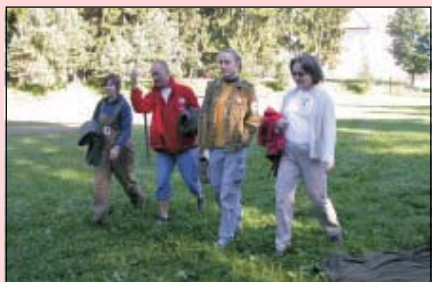
Čtyři stateční (družstvo č. 6 – doprovody)