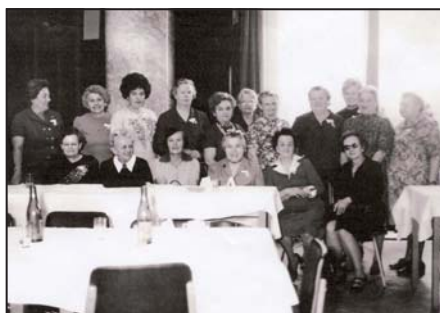
Jak jsme se změnilы ...

na svých křídlech znaky červeného kříže a červeného půlměsíce.