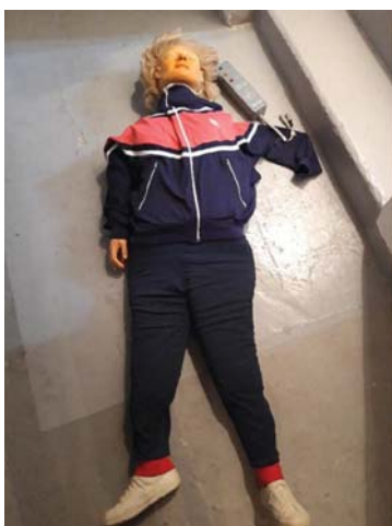
ANDULA přelomu 60/70 let 20.st.

Tato výborná pomůcka neušla pozornosti ČSČK. Na jeho okresních úřadech se objevil vedle dlah, zdravotnických brašen a tašek s obvazovým materiálem i velikánský kufr s Andulou. Horní polovina figuríny byla pevná, tuhost odpovídala přirozené tuhosti lidského těla. Hlava byla obdařena bohatou blond kšticí, obličej byl správně mrtvolně bledý, šije, ač pevná, umožňovala dokonalý záklon hlavy, který je vysoce nutný při umělém dýchání. Končetiny byly nafukovací. K nácviku připravená Andulka budila zaslouženou pozornost pro svůj značně realistický vzhled. Nezapomenu na zhroucení statného traktoristy, který si večer po šichtě zašel do hospody na nějaké to pivo. Vstoupil do lokálu netuše, že tam probíhá kurz PP a spatřil před sebou na stole bezvládně ležet zsinanou Andulu. Perfektní vrtil se složil do mdlob, až to zadunělo. Hospodou se rozhlaholil smích a místo neživé Andulky jsme se ujali skutečného případu muže v bezvědomí.