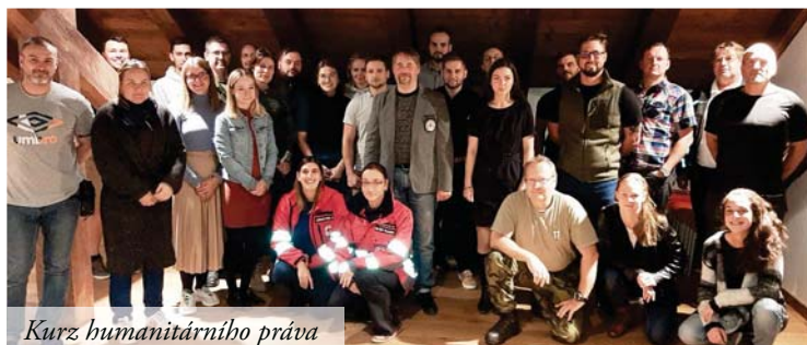
Kurz humanitárního práva

Kurz pořádá ČČK ve spolupráci s Ministerstvem obrany, které na něj vyslalo 17 účastníků – příslušníků AČR. Doplnilo je 15 „civilních účastníků“ - z řad diseminátorů ČČK, městské i státní policie, Národního památkového ústavu a studentů Univerzity Palackého.