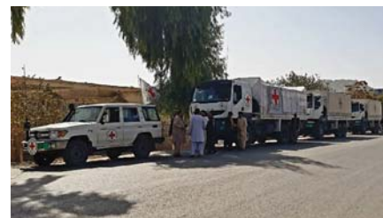
Doprava léčiv a generátorů do Mirwaisovy nemocnice

vilo přes 68.000 pacientů, za celý rok 500 tisíc (z toho 155 žen). Dále podporuje Mirwaisovu regionální nemocnici v Kandaháru, získala tři generátory na výrobu elektřiny a léčiva, měsíčně ošetří 37.000 pacientů.