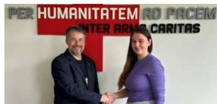
Blahopřání prezidenta ČČK nové prezidentce Mládeže ČČK

Nově ustavenému vedení i Mládeži ČČK přejeme, aby byli přidanou hodnotou pro poslání a činnosti ČČK nejen ve svých OS ČČK, ale i v republikovém měřítku.